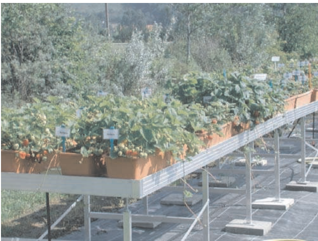
Abb. 1. Kastenanlage der Erdbeergenbank am Standort Dresden-Pillnitz.

Neben der Erhaltung sind die Charakterisierung und Evaluierung der genetischen Ressourcen wichtige Arbeitsschwerpunkte. Erst auf dieser Grundlage lassen sich die Ressourcen den unterschiedlichen Verwendungen zuführen. Züchterisch bedeutsame Merkmale, wie Fruchtqualität, Fruchthaltstoffe sowie Resistenz gegenüber biotischen und abiotischen Faktoren, spielen dabei eine entscheidende Rolle. Die Bewertungen erfolgen durch morphologische und phänologische sowie biochemische und molekulargenetische Analysen. Dabei arbeitet das Institut eng mit den in Dresden-Pillnitz ansässigen Einrichtungen (Hochschule für Technik und Wirtschaft, Sächsisches Landesamt für Umwelt, Landwirtschaft und Geologie) und den anderen JKI-Instituten zusammen. Die Überprüfung der Sortenechtheit erfolgt in Kooperation mit dem Pomologen-Verein