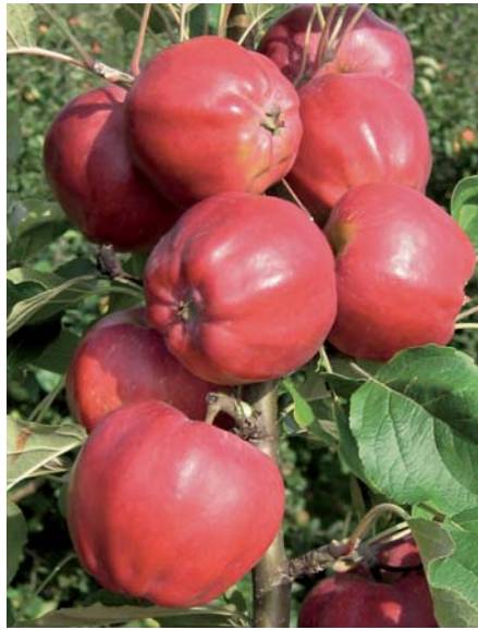
'Roter Herbstkalvill' – alte französische Herbstsorte aus der Auvergne, die bereits um 1670 beschrieben wurde.