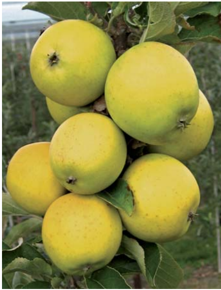
'Ananasrenette' – alte (vermutlich holländische) Apfelsorte, die bereits um 1820 im Rheinland angebaut wurde.

Ein neues Konzept zur Erhaltung heimischer obstgenetischer Ressourcen