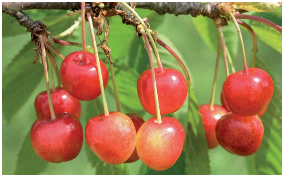
'Kunzes Kirsche' – stammt ursprünglich aus Wallhausen (Kreis Sangerhausen) und ist vor allem in Mitteldeutschland (Sachsen-Anhalt, Thüringen und Hessen) verbreitet.