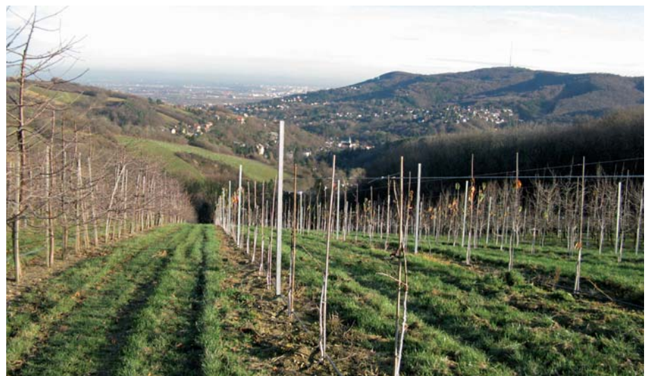
Kirschenversuche an der Höheren Bundeslehranstalt in Klosterneuburg.

Aprikosen stellen den Schwerpunkt der Versuchsarbeit dar. Die Teilnehmer nahmen wichtige Informationen zu Fragen der Qualitätsstandards, Sorten- und Unterlagewahl sowie zum Anbau unter Folienüberdachung mit. Da die geographische Lage und die Böden mit einigen deutschen Anbaugebieten vergleichbar sind, war das Interesse vieler Teilnehmer groß, Aprikosen auch in ihren Betrieb als Alternativkultur einzubauen.