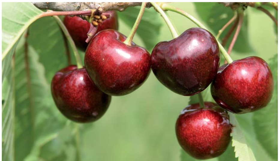
'Grolls Schwarze' – stammt ursprünglich aus Guben a.d. Neiße. Ist auch heute noch hin und wieder im Streuobst zu finden.

Um die Echtheit der zu erhaltenden Sorten zu gewährleisten, wird eine pomologische Echtheitsprüfung durchgeführt.